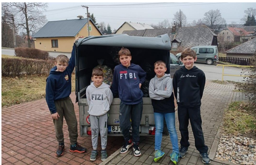
Děkujeme všem, kteří nám pomáhají ve škole sbírat hliník. Má to smysl. Na začátku března jsme do sběru odevzdali 122 kg hliníku a na účet školy si tak připsali 1952 Kč. Foto: ZŠ

Žáci základní školy udělali u školy vzácný objev, všimli si rosničky zelené, která je ohroženým druhem a je zákonem přísně chráněna. Foto: ZŠ