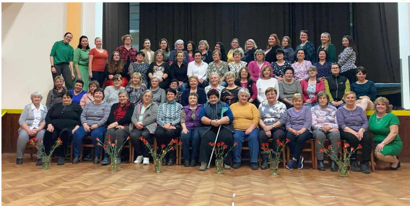
Oslava Mezinárodního dne žen.